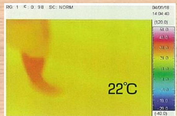
傷みのない築20年の家(100年健康住宅)

サーモカメラを見ると、エアコンを23°Cに設定し運転している時、1階床が温度ムラなく22°C前後に保たれているのが分かります。